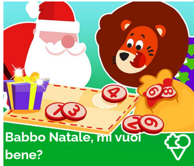
Babbo Natale, mi vuoi bene?